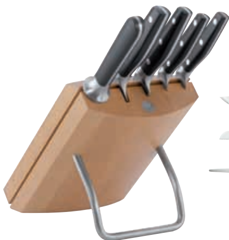
33041-000 Bloque cuchillos, 6 pzs. Ceppo di coltelli, 6 pz Messenblok, 6-dlg.