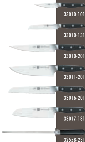
33042-000 Bloque cuchillos, 8 pzs. Ceppo di coltelli, 8 pz Messenblok, 8-dlg.